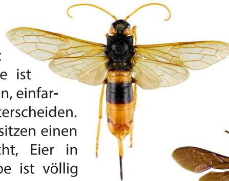
Riesenholzwespe, Urocerus gigas

Die Riesenholzwespe , Urocerus gigas , ist eine Pflanzenwespe deren Larven sich von Holz ernähren. Diese schwarz-gelb gefärbte Wespe ist durch ihren zylindrischen Körper und ihre langen, einfarbig gelben Fühler, leicht von Hornissen zu unterscheiden. Weibchen können 45 mm lang werden und besitzen einen langen Legebohrer, der es ihnen ermöglicht, Eier in Holzstämmen abzulegen. Die Riesenholzwespe ist völlig harmlos.