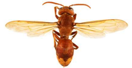
Orientalische Hornisse, Vespa orientalis

Wespen sind kleiner als Hornissen. Arbeiterinnen werden im Spätsommer etwa 15 mm lang. Es ist zu beachten, dass Wespenköniginnen etwas größer als 20 mm werden können, also etwa so groß wie die hier abgebildete Asiatische Hornisse ohne den Kopf. Im Frühling können Wespen daher größer als die ersten geschlüpften Hornissen-Arbeiterinnen sein.