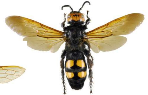
Rotstirnige Dolchwespe, Megascolia maculata

Die Rotstirnige Dolchwespe , Megascolia maculata , ist eine der größten Europäischen Wespen und wird daher oft mit der Asiatischen Hornisse verwechselt. Sie ist dicht behaart auf einem meist glänzend schwarzen Körper. Ihr Kopf ist an der Oberseite gelb, der Hinterleib weist vier unbehaarte gelbe Flecken auf. Sie parasitiert die Larven großer Käfer (z.B. des gemeinen Maikäfers).