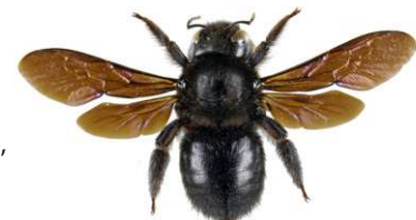
Blaue Holzbiene, Xylocopa violacea

Die Blaue Holzbiene , Xylocopa violacea , ist 20 bis 30 mm lang, vollkommen schwarz gefärbt und schimmert violett-blau. Die Weibchen dieser Solitärbieneart bauen ihre Nester in mürbem Totholz und sammeln Pollen als Nahrung für ihre Brut.