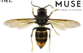
Asiatische Hornisse, Vespa velutina

Die Europäische Hornisse , Vespa crabro , hat einen überwiegend blassgelben Hinterleib mit schwarzen Streifen. Die Kopfvorderseite ist gelb, die -oberseite rotbraun gefärbt. Brust und Beine sind schwarz und rotbraun. Arbeiterinnen erreichen eine Körperlänge von 18 bis 23 mm, Königinnen 25 bis 35 mm.