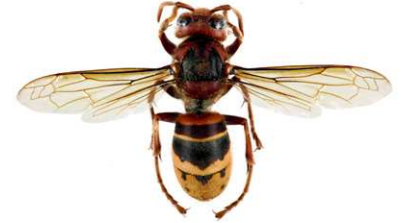
Europäische Hornisse, Vespa crabro

Die Orientalische Hornisse , Vespa orientalis , entspricht in der Körpergröße der Europäischen Hornisse. Sie hat eine rotbraune Grundfärbung, lediglich die Kopfvorderseite sowie eine Binde um den Hinterleib sind gelb. Sie kommt nur in Südosteuropa vor (Süditalien, Malta, Albanien, Griechenland, Zypern, Rumänien, Bulgarien).